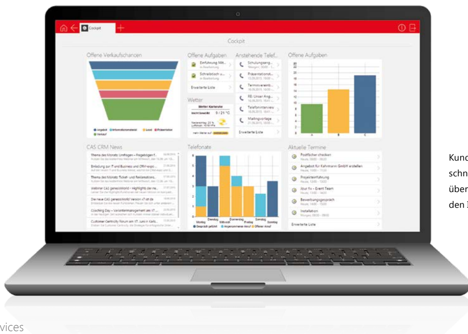
Kundencockpit – schneller Überblick über alle entscheidenden Informationen.

Eine zentrale Datenbasis für alle erleichtert sowohl die Terminkoordination, Aufgabenverwaltung, Dokumentenbearbeitung als auch die gemeinsame Projektarbeit und Lösung von Supportfällen. Ihre Mitarbeiter erteilen kompetente Auskünfte, treffen fundierte Entscheidungen und erleben spürbare Erleichterung in ihrer täglichen Arbeit. Das motiviert und spart Zeit für das Wesentliche – Ihre Kunden.